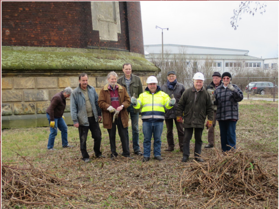
19. März – Arbeitseinsatz Bereinigung Wasserturmumfeld