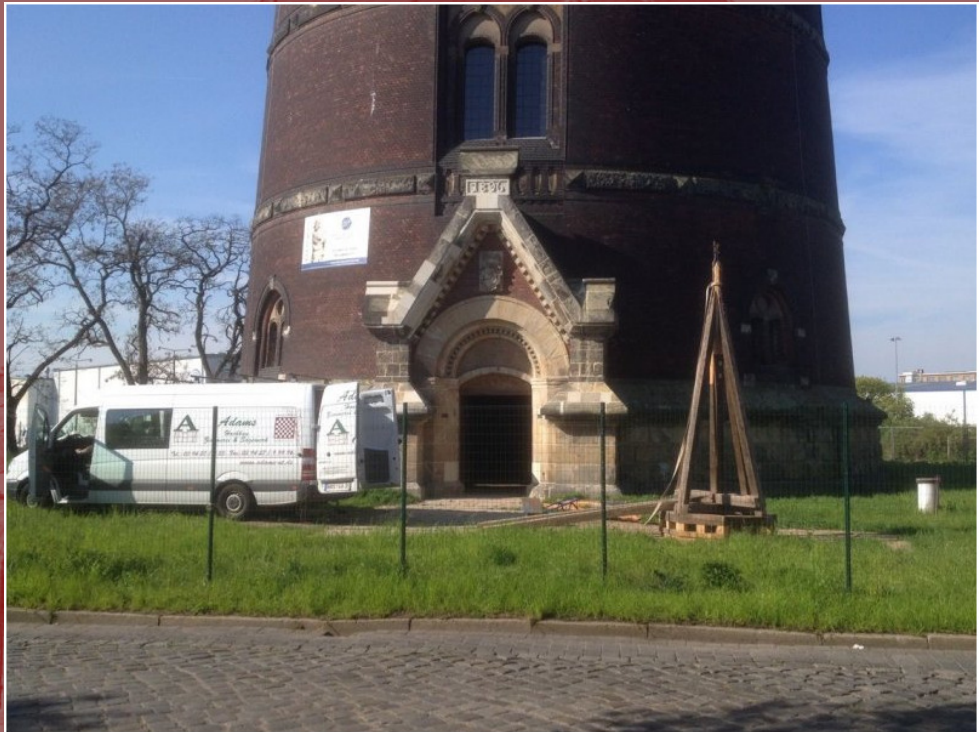
3. Mai – Bereitstellung Dachstuhl für 3. Erkerturm (Fa. Adams)