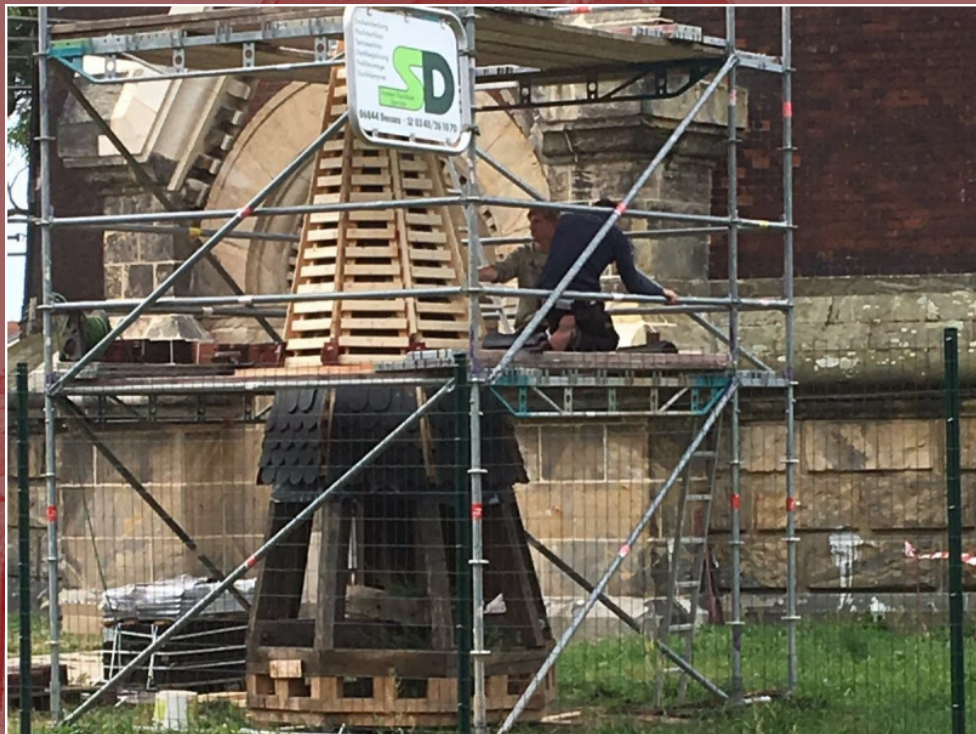
9. August - Eindeckung Turmdach (Fa. System Dachbau Service)