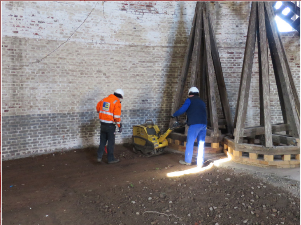
9. März – Verdichtung des Schüttgutes (Fa. Echterhoff)