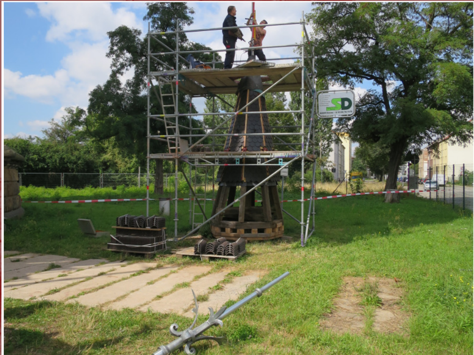
17. August – Vorbereitung Montage Turmspitze (Kunstschmiede Schönemann)